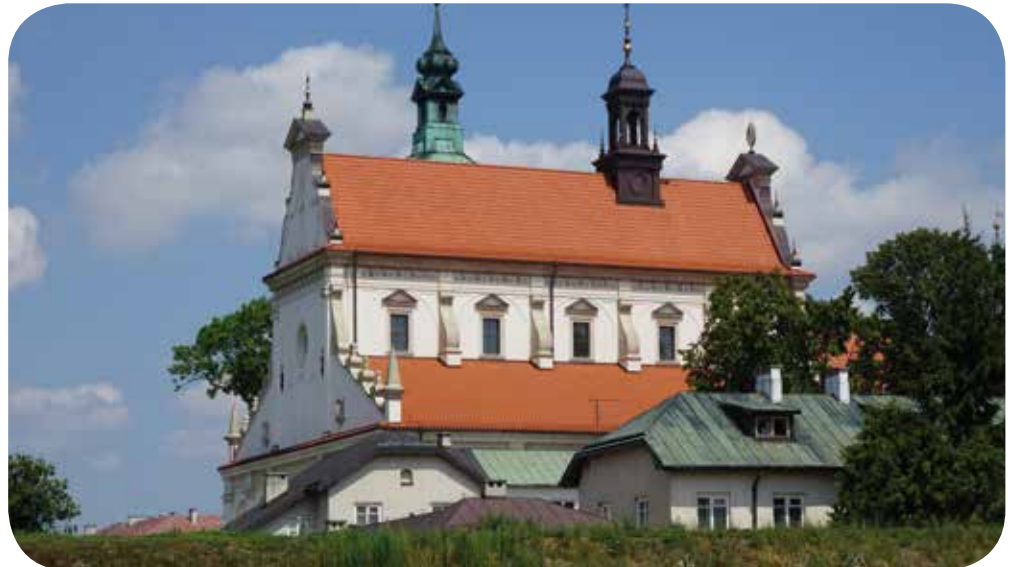
Dom in Zamość