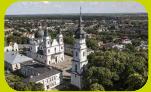
Basilika Mariä Geburt, Chełm