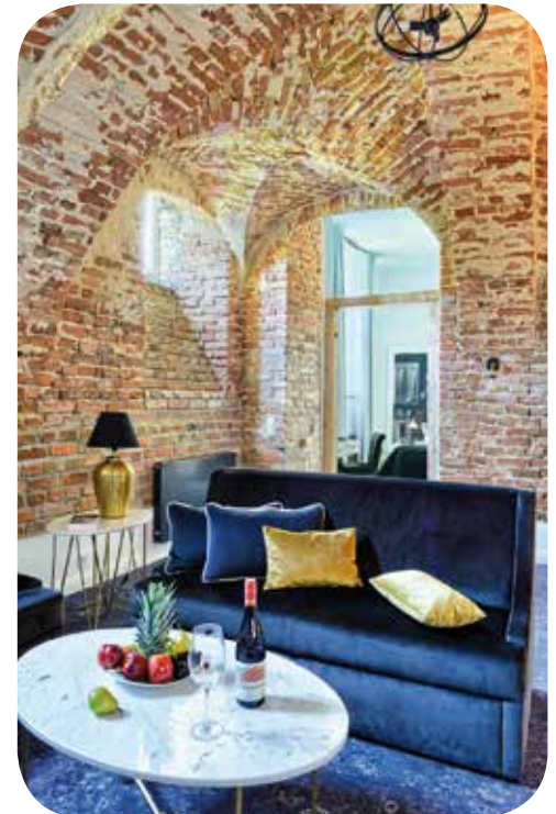
Apartment, Zamek Janów Podlaski