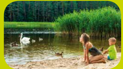
Teiche „Echo“, Zwierzyniec