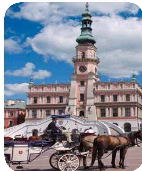
Bürgerhäuser auf dem Marktplatz, Zamość