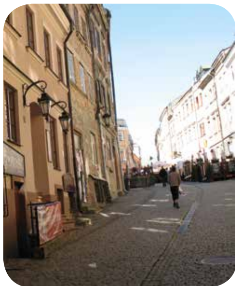
Ulica Grodzka, Lublin