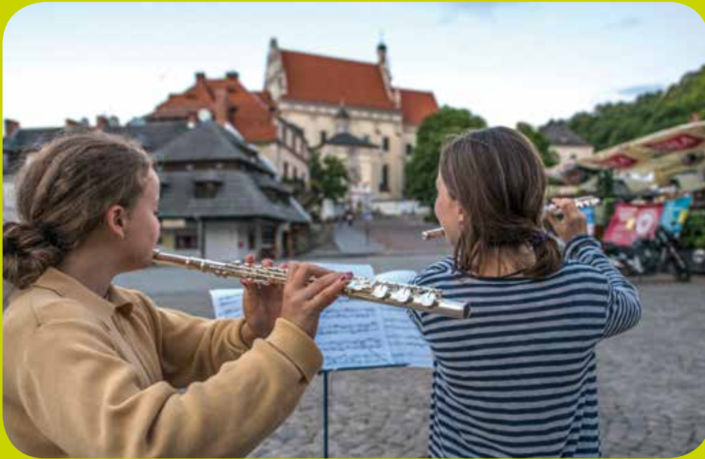
Marktplatz, Kazimierz Dolny