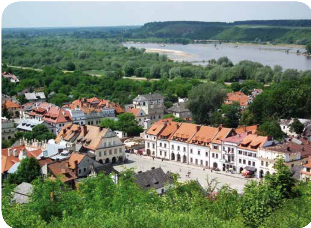
Stadt von oben, Kazimierz Dolny