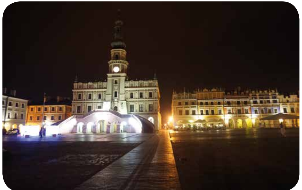
Marktplatz bei Nacht, Zamość

Individualtouristen und Reisegruppen Verfügbarkeit des Angebots: Mai – September