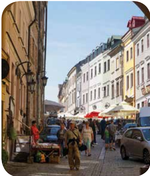
Ulica Grodzka, Lublin