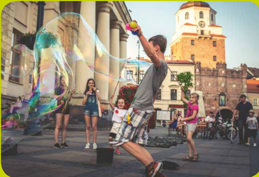
Krakauer Vorstadt, Lublin

Diese auf der touristischen Landkarte Polens außergewöhnliche Stadt ist