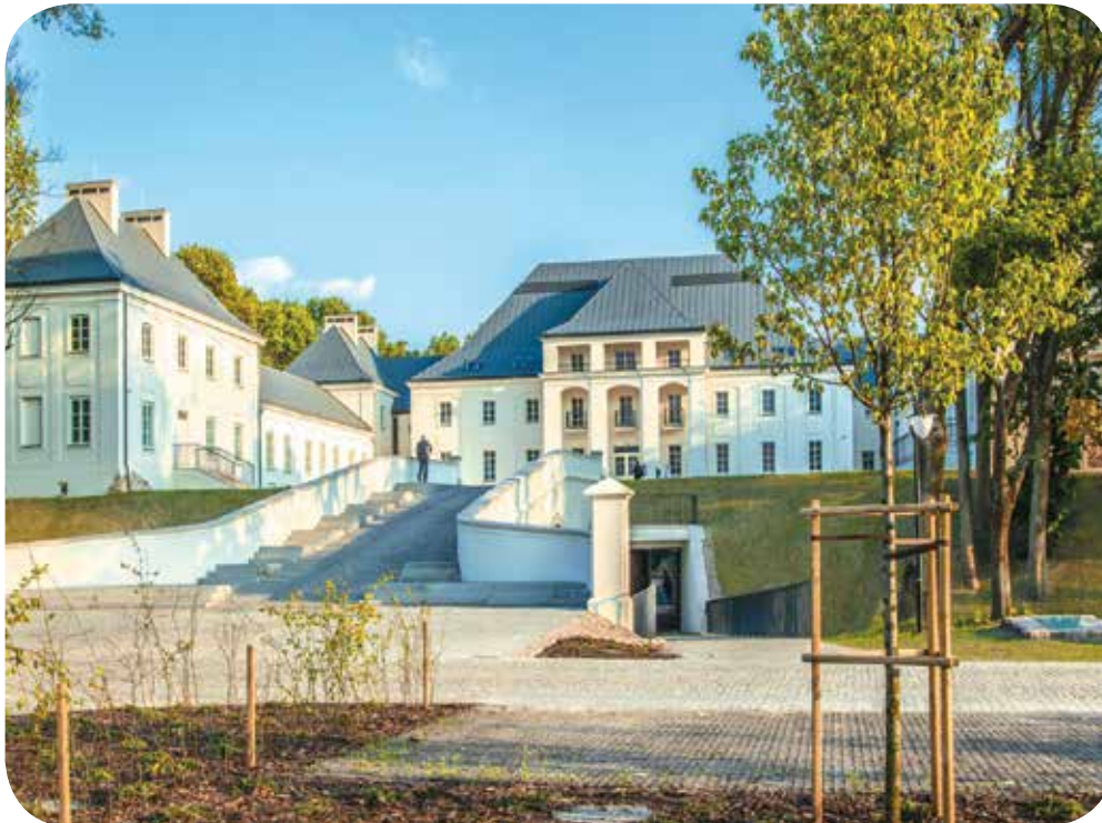
Schloss Janów Podlaski