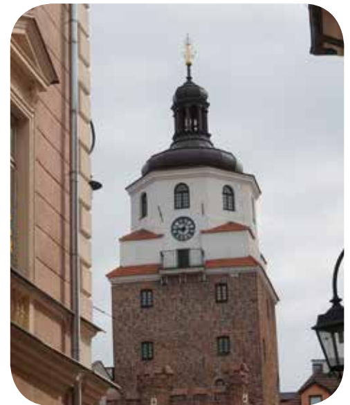
Krakauer Tor, Lublin