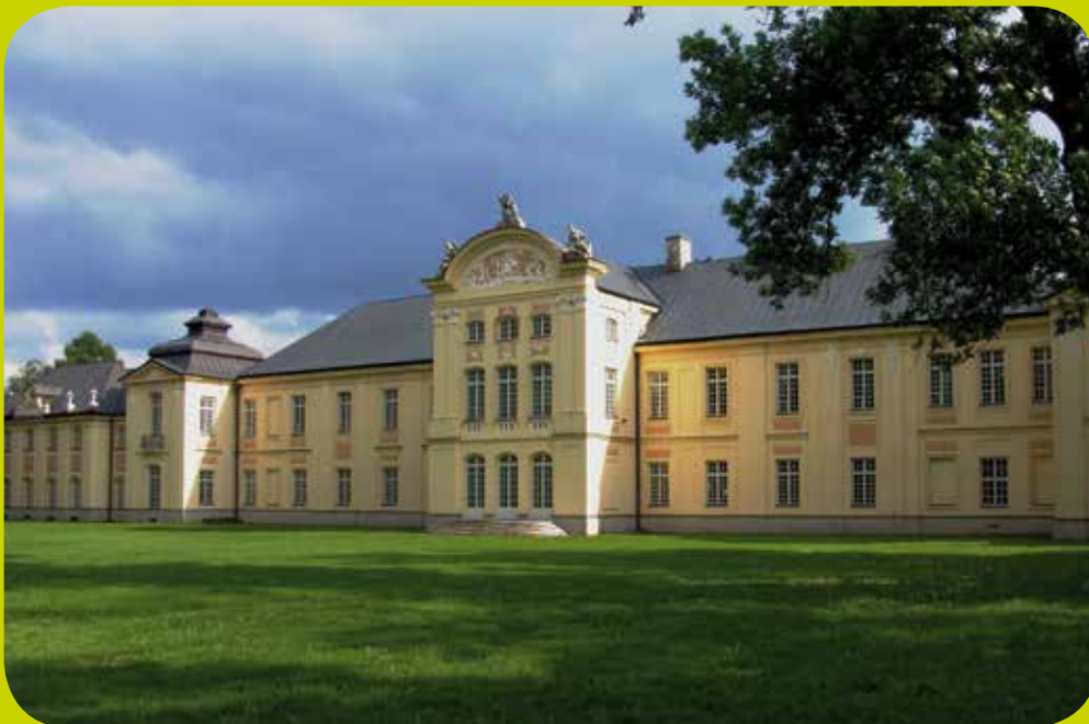
Palais, Radzyń Podlaski

Dank der einzigartigen Natur ist diese Region ein idealer Ort für die aktive Touristik, denn Radfahrern steht hier ein