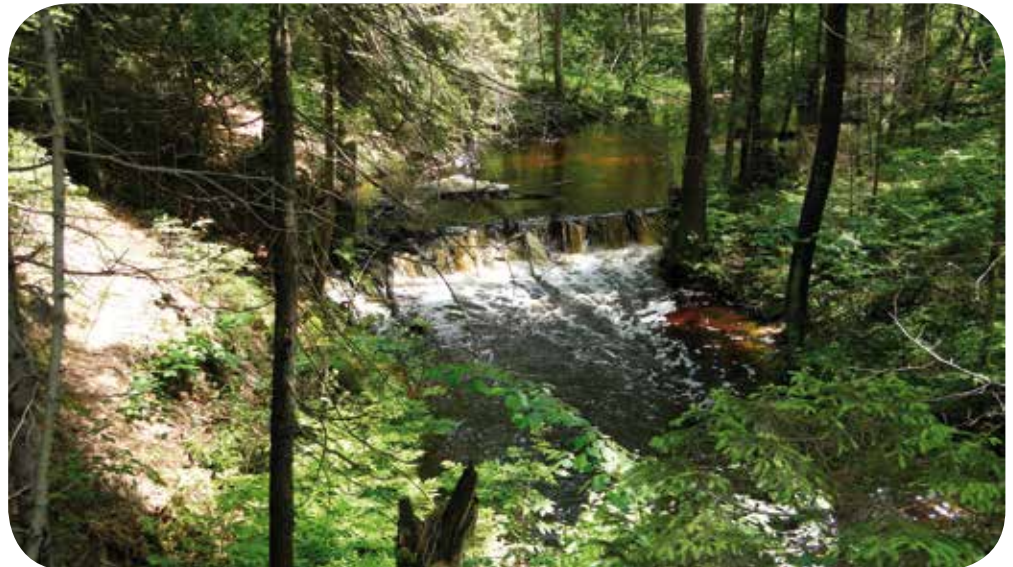
Wasserfälle „Szumy“ am Fluss Tanew, Susiec