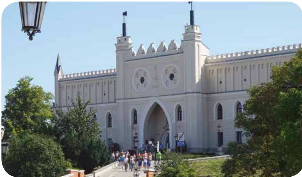
Lubliner Schloss, Lublin

Warschau – Spaziergang durch die Altstadt. Besichtigung des Königsschlosses. Łazienki-Palast – Spaziergang durch den historischen Garten, Palais auf der Insel, Alte Orangerie. Auf Wunsch Besuch einer Aufführung in der Oper.