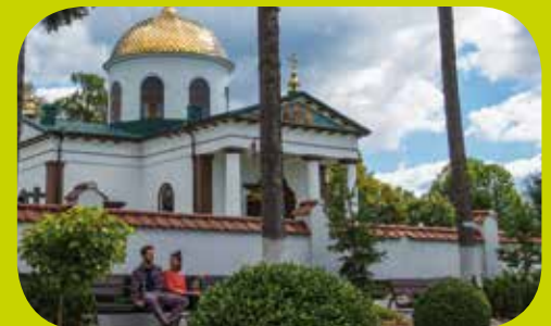
Kloster des Hl.Onufry, Jabłeczna