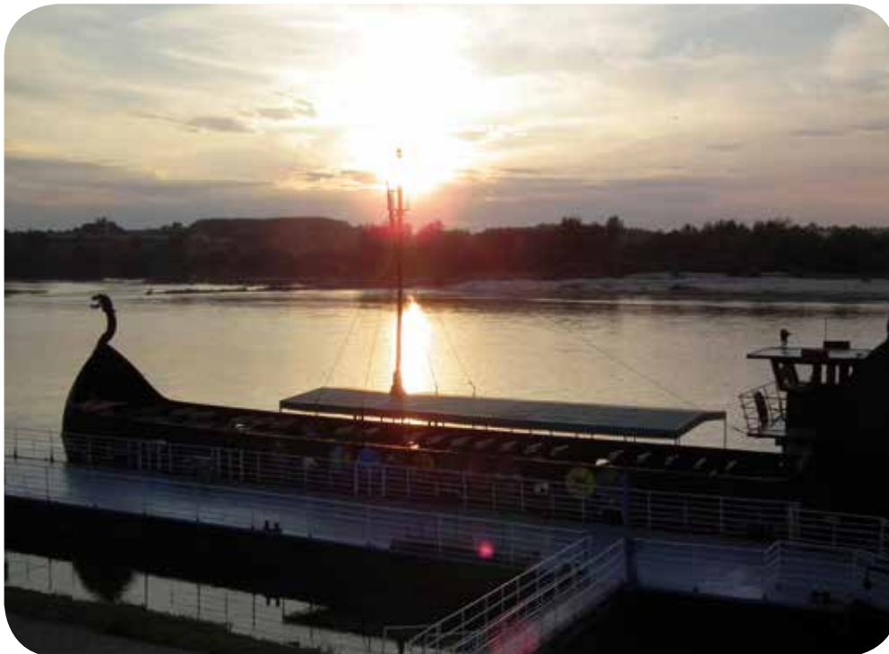
Am Ufer der Weichsel, Kazimierz Dolny