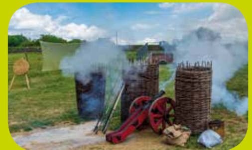
Bastion VII, Zamość