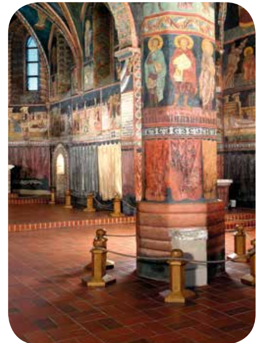
Dreifaltigkeitskapelle auf dem Schloss, Lublin