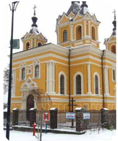
Auf der Kirchen-Route, Tomaszów Lubelski