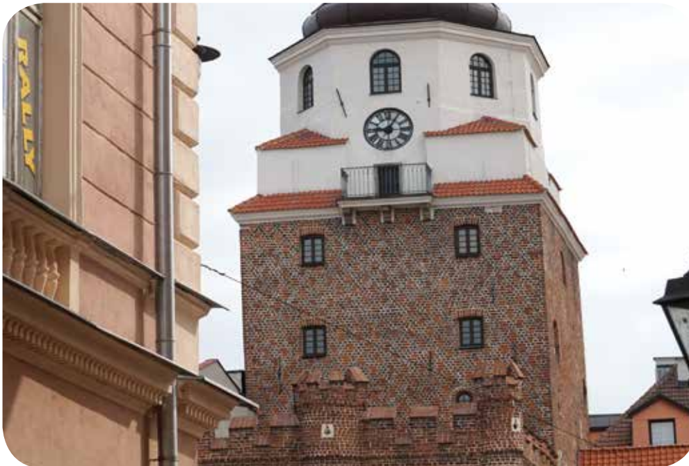
Krakauer Tor, Lublin