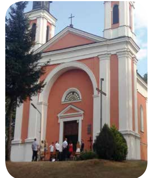
Kirche in Tyszowce