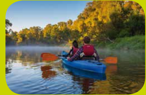
Kajak-Tour auf dem Fluss Bug

330-km-langes Netz gekennzeichnete Radwege zu Verfügung, die zu den interessantesten Orten führen. Die historische Hauptstadt dieser Region ist Łuków. Im Ort besonders sehenswert sind zwei barocke Kirchen-Kloster-Anlagen sowie das Regionalmuseum mit reichen ethnografischen und geologisch-archäologischen Sammlungen und einer Ausstellung, die Ammoniumnitrate aus den hiesigen Gletschereisschollen der Jura-Zeit präsentiert. Die Region Ziemia Łukowska ist mit ihrer reichen Vergangenheit und ihren ehrenvollen patriotischen Traditionen