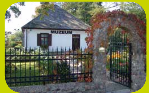
Henryk-Sienkiewicz-Museum, Wola Okrzejska