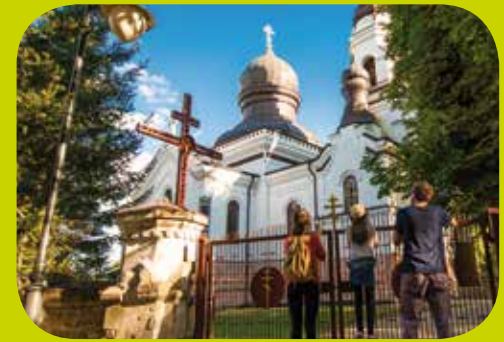
Kirche Mariä Geburt, Włodawa