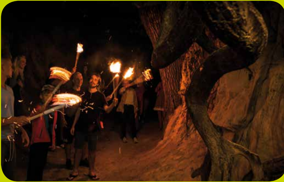
Wurzelschlucht, Kazimierz Dolny