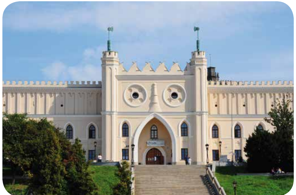
Lubliner Schloss, Lublin