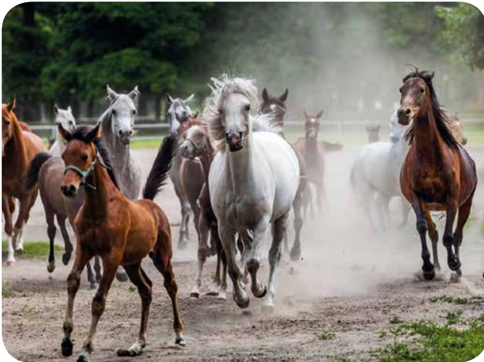
Reinrassige Araberpferde im Gestüt in Janów Podlaski