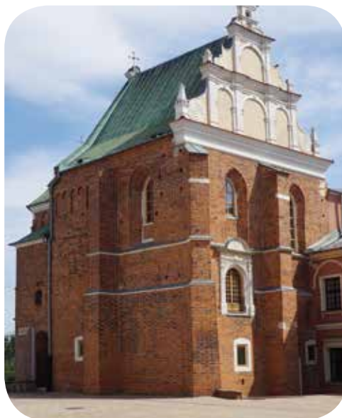
Dreifaltigkeitskapelle auf dem Schloss, Lublin