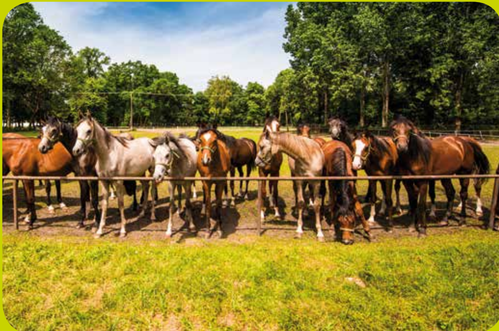
Pferdegestüt, Janów Podlaski

ein effektvolles und restauriertes Bauwerk aus dem 17. Jahrhundert. Das Palais ist von einem historischen Park umgeben, im Turm über der Einfahrt hingegen befindet sich das Museum der Region Süd-Podlasie, wo die größte Ikonensammlung Polens mit 1400 Werken besichtigt werden kann. Sehenswert ist außerdem der Marktplatz, der von einer niedrigen, zweistöckigen Bebauung umgeben ist, die zusammen mit den wunderschönen Bürgerhäusern aus dem 19. Jahrhundert der Stadt einen einzigartigen Charakter verleiht. Es lohnt sich, diese außergewöhnliche Stadt im Spätherbst zu besuchen, da dann das Jazzfestival „Zaduszki Jazzowe“ stattfindet.